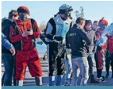
De intocht liep vorig jaar uit de hand.

Vorig jaar liep de intocht uit de hand tijdens een confrontatie bij de afrit van de A28 bij Staphorst. Actievoerders van Kick Out Zwarte Piet (KOZP), die hadden aangekondigd te komen demonstreren tegen de aanwezigheid van zwarte pieten, werden in hun auto's belaagd door inwoners van Staphorst. De gemeente besloot de demonstratie van KOZP voortijdig te